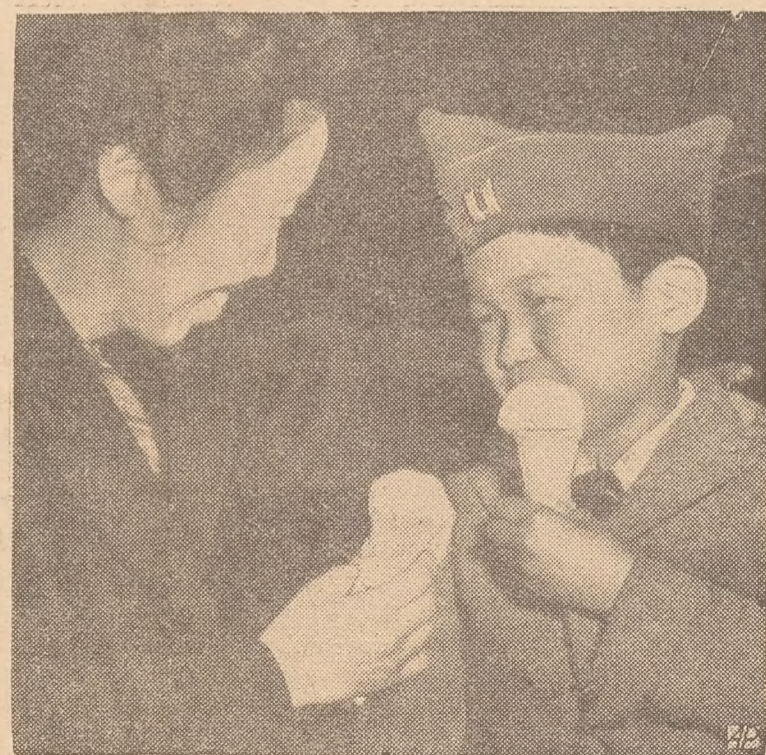
IJS IN JAPAN

We mochten het jaarverslag ontvangen van de C.B.L.O. waaruit blijkt dat er met veel toewijding gezorgd is ons volk sport te geven ook laat men zien, hoe het nog moeilijk is om ons volk in staat te stellen door sport, ontspanning en lichamelijke oefening te vinden, zo noemt men de financiën en de weinige faciliteiten de grote moeilijkheden.